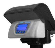
RX-79B/DVS-EC – ¾"