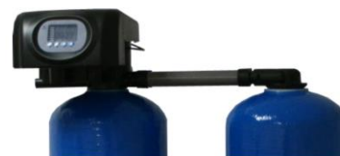
RX-73A/DVS - 1"