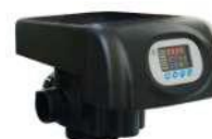
RX-75A/DTF - 2"