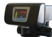
RX-67B/DTF - 1"