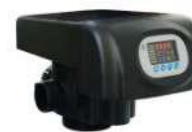
RX-75A/DTF - 2"