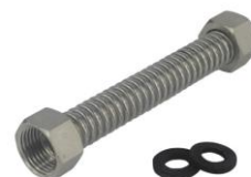
AZ nerezová hadica