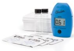
Ručný kolorimeter HI...