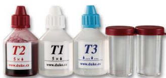
Sada DUKE na meranie tvrdosti vody