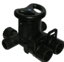
Montážny blok Plast