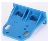
Plast.konzola filtra AQA