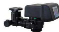
RX-63B/DVS - 1"