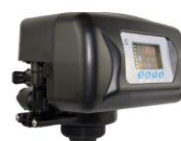
RX-92A/DVS - 1"