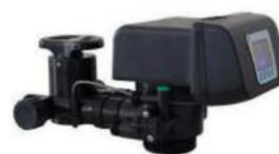
RX-63B/DVS - 1"