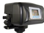
RX-92A/DVS - 1"