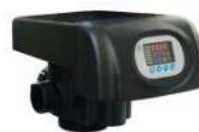
RX-74A/DVS - 2"