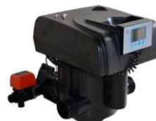
RX-99A/DVS - 2"